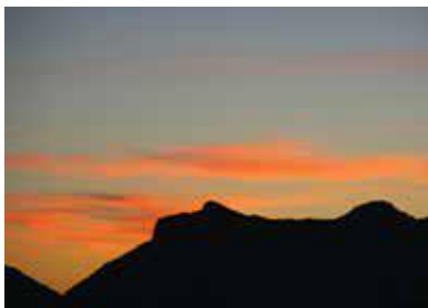
Coucher de soleil